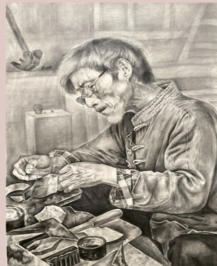
绘画作品：《匠心铸魂》 作者：王丽君

作品简介： 新疆维吾尔自治区少数民族众多，拥有多元的民族文化。不同的少数民族服饰，表现出不同的民族性格，以及人们对生活的不同追求。画中少女姿态端庄而典雅，衣饰精致且富于变化，目光柔和和清澈，安静地凝视着前方，温婉的气质给人以生命之美的视觉感受，展示了塔吉克族同胞热爱生活、热爱自然的生活状态。