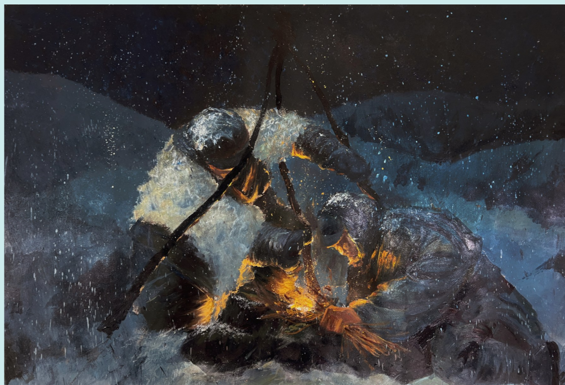
绘画作品：一等奖《星星之火》 团队成员：孙晨阳 路力权