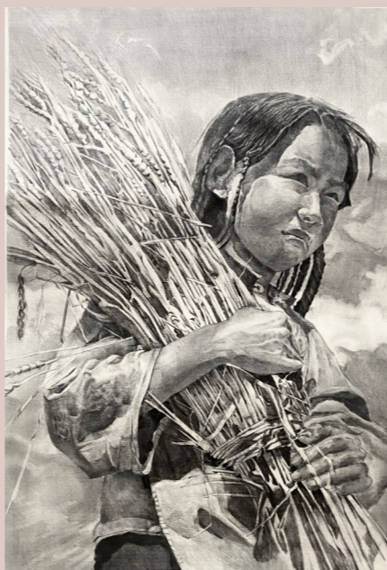
绘画作品：《风吹藏稞》 作者：张轩友

作品简介： “工匠精神”永不褪色。在新时代，鞍钢的工人们将“工匠精神”赋予了新的诠释和新的活力。鞍钢工匠们，在白莲绽放的季节，挥散着努力的汗水，慢慢地打造属于自己的精品人生。一支烟，一个匠人，诉说着他们自己的精神故事。