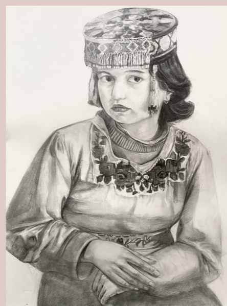
绘画作品：《塔吉克族少女》 作者：徐晨希

作品简介： 画中是一位来自藏族的少女，她穿着藏族服饰，迎着耀眼而又温暖的阳光，抱着饱满的青稞穗，站在广阔蔚蓝的天空之下。作品反映出藏族人民勤劳不辍、热爱生活的美好品质。这位少女也仿佛在说：“我热爱我的家乡，我热爱我的祖国，我热爱我所生活的这片土地。”