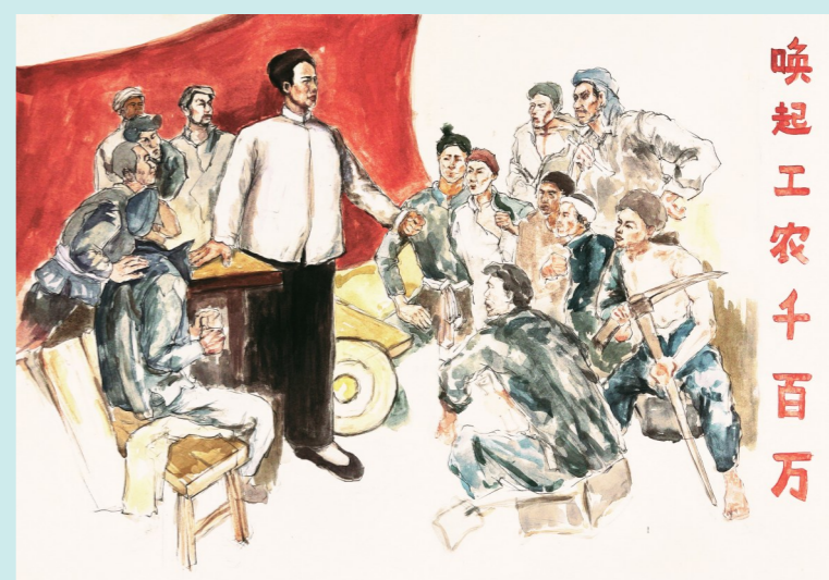
绘画作品：二等奖《唤起工农千百万》 团队成员：乔建翔 陈鑫越