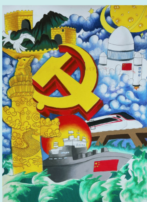
绘画作品：二等奖《我们的新时代》 团队成员：柴诗怡 苗雨欣