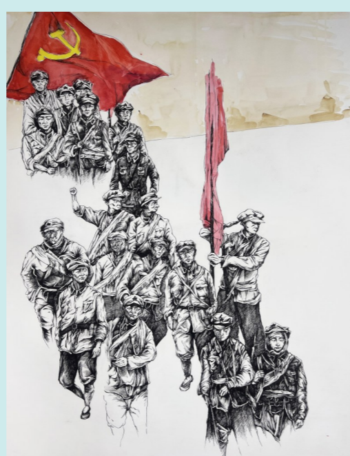
绘画作品：一等奖《追寻》 团队成员：徐祥瑞 高田田