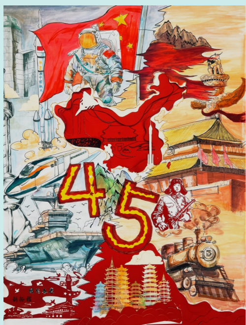
绘画作品：二等奖《改革新征程》 团队成员：马婧怡 郝翰文 徐杰